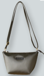
B. ナイロンショルダー／mini ●●●●