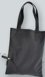
E. 折りたためる撥水バッグ ／コンパクト ●●●● 撥水