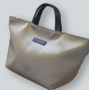
F. ナイロントートバッグ ／medium ●●●●