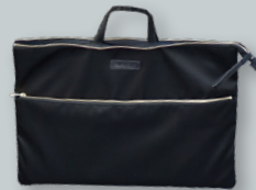
L. PC&タブレット用バッグ ●