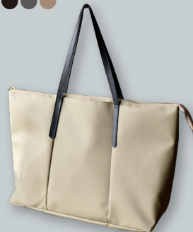
R. 大人トート ●●●● 撥水