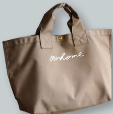
M. ロゴトートバッグ ／medium ●●●● 撥水