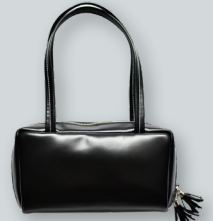
D. 艶やかレザーのキューブバッグ ●