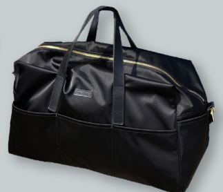
T. ツヤがきれいなポストンバッグ ●