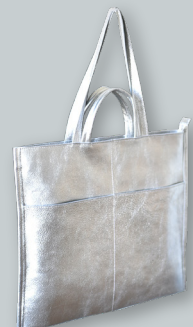
O. 2WAYフィットトートバッグ ●●