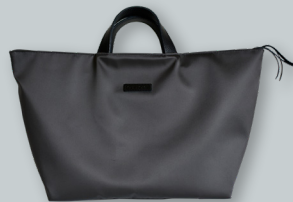
N. ナイロントートバッグ／large ●●●●