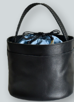
G. こだわりレザーの ポットバッグ ●●●