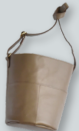
H. こだわりレザーの バケツバッグ ●●●●