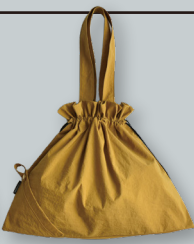
K. 折りたためる撥水バッグ ●●●● 撥水