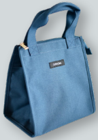
A. 保冷ランチバッグ ●●●● 撥水