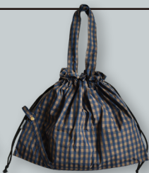
J. 折りたためる チェック柄バッグ ●●