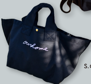
S. ロゴトートバッグ／large ●●●● 撥水