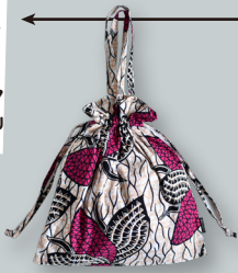
I. アフリカーニャ生地の 巾着バッグ